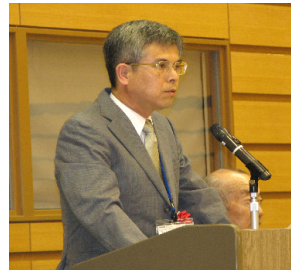
閉会宣言 埼玉県中体連 バドミントン専門部 委員長