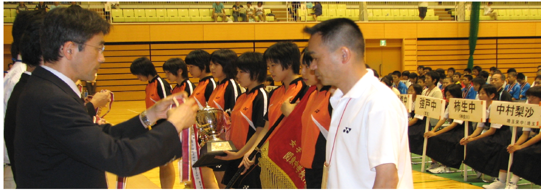
上・右・団体女子優勝 埼玉県