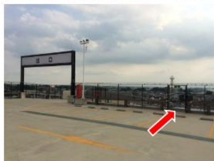
非常階段の出入口（屋上）