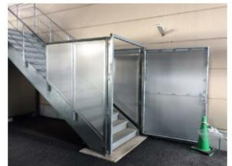
非常階段の出入口（1階）