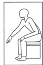
シャトルがコート内に落ちたとき