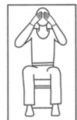
シャトルの落下点が見えなくて、判定できなかったとき