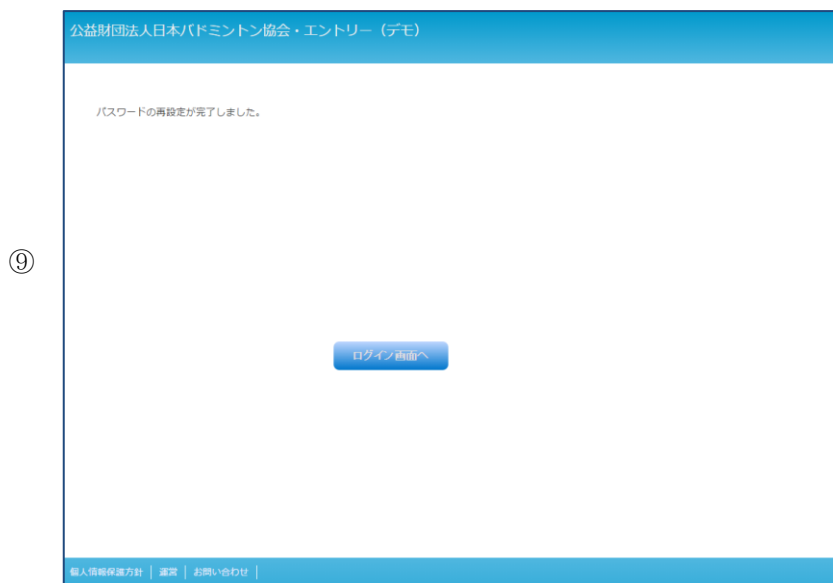
パスワード再設定完了画面