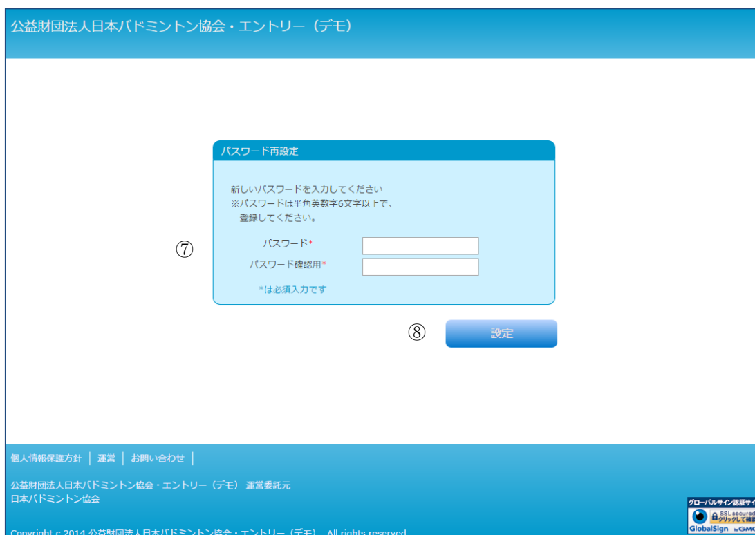
パスワード再設定画面